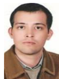
حنائی طیران یزد محمد مسعود

شماره نظام مهندسی: 1009617483 کارشناسی ارشد، ترویج و آموزش کشاورزی استان محل فعالیت: خراسان رضوی شهرستان محل فعالیت: سبزوار رتبه: سه، مشاوران