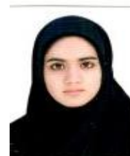
زراعت پیشه ملیکه

شماره نظام مهندسی: 1009717696 کارشناسی ارشد، زراعت و اصلاح نباتات استان محل فعالیت: خراسان رضوی شهرستان محل فعالیت: مشهد رتبه: ندارد